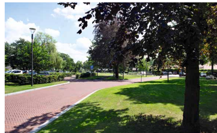
Vanaf de Joppelaan loopt een pad van rode baksteen de dorpsweide in, richting de twee parkeerterreinen.

Het pad leidt naar twee parkeergebieden. Het rechter parkeerveld, achter De Roskam, vormt een inbreuk op deze zo zorgvuldig gecomponeerde groene idylle. Waarschijnlijk kwam dit plandeel tijdens de ontwerpfase onvoldoende aan bod, omdat het behoorde bij De Roskam – inmiddels ook in bezit van Hans Melchers. Het parkeerterrein is omgeven door hoge hagen en bestraat met lichtgrijze betonklinkers. De toegang is niet gesitueerd naast de rode loper, zoals in het ontwerp is beoogd, maar precies in de aslijn. Geparkeerde auto's en lichtreflectie van de bestrating vormen ware stoorzenders. De hoge hagen onttrekken het karakteristieke dakenlandschap van de achterliggende school aan het zicht. In het linker parkeerveld manifesteert zich de ruimtelijke impact van gras, bomen en hagen zoals in het ontwerp bedoeld. Vanaf de oostrand van de dorpswei is dit prachtig te zien: een groen tapijt, gestoffeerd met