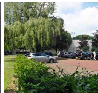
Een parkeerveld is omringd door een lage haag, waardoor het terrein deel uitmaakt van de dorpswei.

De komst van het museum en de zorgvuldig ontworpen buitenruimte zijn de kersen op de taart van de transformatie van de gehele Gorssele dorpskern. Naar ontwerp van BRO kreeg de Hoofdstraat een opgetild trottoir, dat het hoogteverschil tussen de twee zijden van de oude straatweg dramatiseert. Deze prachtige, in hardsteen uitgevoerde dorpspromenade bestrijkt over ruim 250 meter de oorspronkelijke wegwak, en snijdt het aanliggende terrein