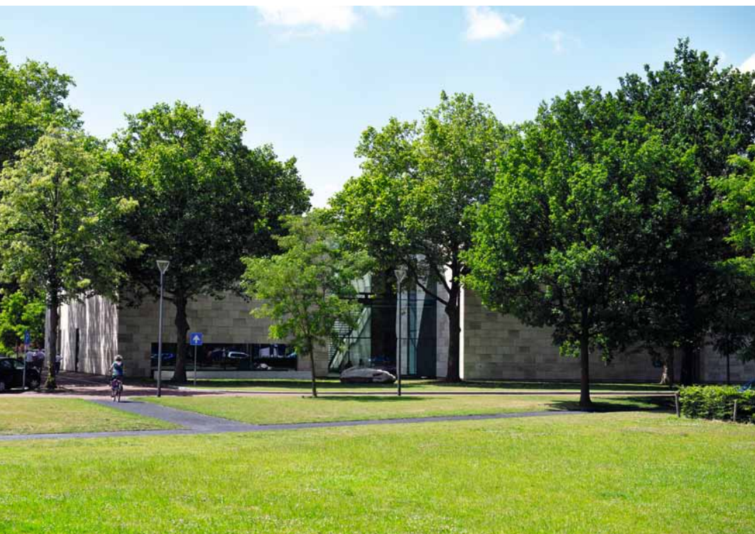
Van onder rode beuken loopt een smal asfaltpad verder door het gras.

van de Hoofdstraat staat. De entree van het museum ligt aan de achterzijde, aan de Joppelaan. De zijdelings verspringende zalen van de nieuwbouw zijn ingebed in één doorlopend grastapijt. Zo ontstaan langs de Joppelaan eenvoudige groene driehoeken die de sfeer van dorpsweide tot in de Hoofdstraat brengen.