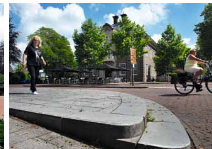
Het opgetilde trottoir in de Hoofdstraat dramatiseert het hoogteverschil tussen beide straatzijden.

van villa Oldenhof aan, oit een particuliere vrouweninrichting voor welgestelde zenuwlijders, nu een gezondheidscentrum. Monumentale lindes, eiken en beuken, onder andere uit de voormalige gestichtstuin, staan verspreid over de promenade en zorgen voor een aangename luchtigheid. De naastgelegen villa Everdina, oit het optreke van de geneesheer-directeur, doet sinds kort dienst als collectieve zorgwoning met theehuis. Het opgetilde voorterras markeert het beginpunt van de dorpspromenade. Het is gemakkelijk om de later aan de Hoofdstraat toegevoegde dorpspomp en banken af te serveren als 'slecht ingepast' en het scala aan plantenbakken en reclame-uitingen te bestempelen als verrommeling. Maar dat zou de hele herinrichting tekort doen. Het dorpshart heeft een hechte samenhang gekregen – het resultaat van zorgvuldig sturen en een samenwerking